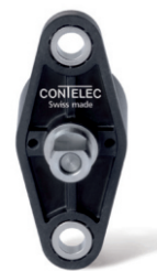
Vert-X 16 订购代码 版本 C